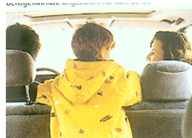
Danger mortel: non attaché entre les deux sièges avant