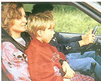
Danger mortel: non attaché sur les genoux

Le conducteur est tenu de s'assurer que les enfants soient attachés par un système de retenue. Il en assume l'entière responsabilité.